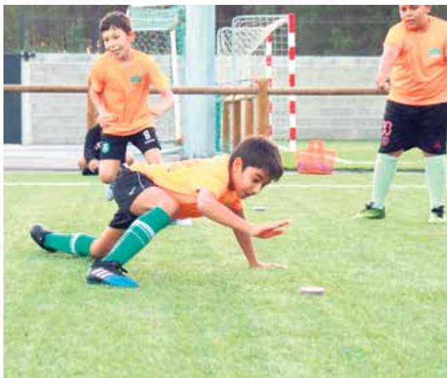
Treino Performance com a Lateral Performance, na equipa de infantis (sub-12)

Primeiramente, havia a necessidade e obrigatoriedade de o MOTOR CLUBE se organizar internamente, a nível estrutural, mas também a nível conceptual, definindo um modelo de jogo, de treino, de jogador, de treinador, de prospeção de atletas e um regulamento interno justo e claro. Depois deste árduo trabalho, o Clube dotou a Academia de Formação MOTOR CLUBE dos recursos humanos certos para as diferentes estruturas, procurando pessoas