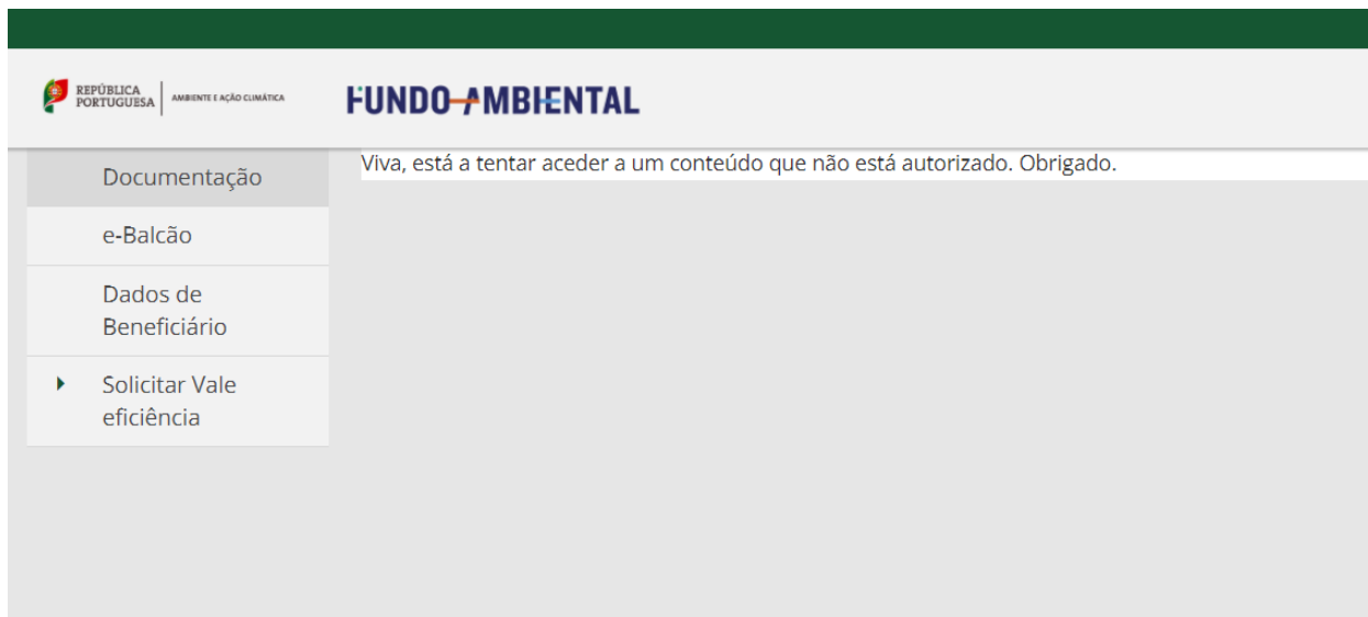
Figura 4 –Área reservada do utilizador Beneficiário

Após introduzir as suas credenciais de acesso irá surgir o seguinte ecrã: