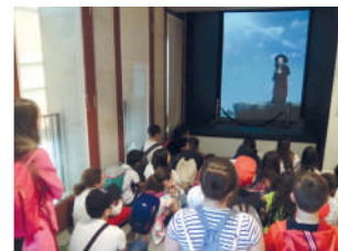
grande Epopeia dos Descobrimientos Portugueses.

destaque para o Infante D. Henrique. A visita, de cariz educativo e lúdico, culminou com um passeio de barco, com partida de Lisboa e chegada ao Brasil, passando pelos territórios portugueses na África e no Oriente. Alunos e professores consideraram muito interessante esta viagem à