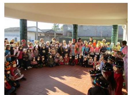
● Casa da Criança Maria Rita Patrocínio Costa

Esta iniciativa permitiu que as crianças conhecessem e experienciassem as nossas tradições, o que promove e valoriza a sua identidade cultural e reforça a interação e os laços com a comunidade.