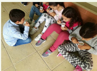
● Alunos do 4.º ano da turma 1MRO3

Com a celebração deste dia reforça-se a importância de fazer uma alimentação saudável ao longo do ano, para crescermos fortes, saudáveis e felizes!