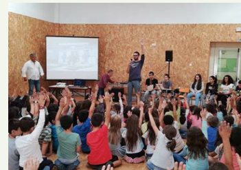
● Alunos MRO2

Abre-te ouvido para os sons do mundo, abre-te ouvido para os sons existentes, imaginados, pensados e sonhados. Abre-te ouvido para a MÚSICA, para o som da flauta, do saxofone, da percussão, do trompete, trombone e de tantos outros instrumentos. Aconteceu no Centro Escolar de Monte Redondo com a visita dos músicos/alunos e professores da Escola de Música da Filarmónica Nossa Senhora da Piedade, que fizeram uma apresentação musical para todos os alunos. Aprendemos os nomes dos diferentes instrumentos, as suas características e ouvimos o seu som. Neste dia, abrimos os nossos ouvidos, mexemos o nosso corpo e aprendemos que a música nos ajuda na concentração, na memória, na criatividade, na comunicação e principalmente ajuda-nos a sorrir.