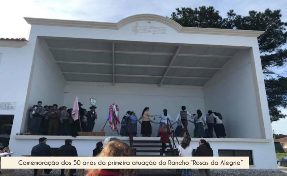
Comemoração dos 50 anos da primeira atuação do Rancho "Rosas da Alegria"