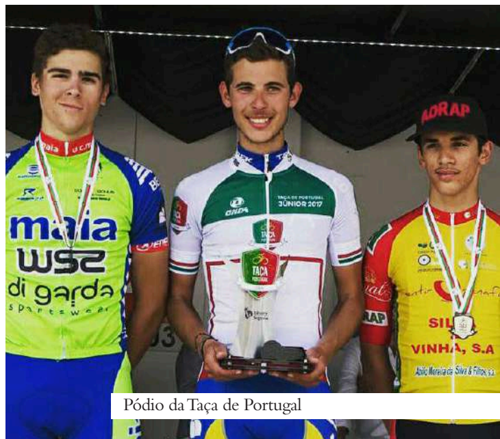
Pódio da Taça de Portugal

no Campeonato da Europa na Dinamarca. Na prova em linha, no Campeonato da Europa, fiquei em 51.º