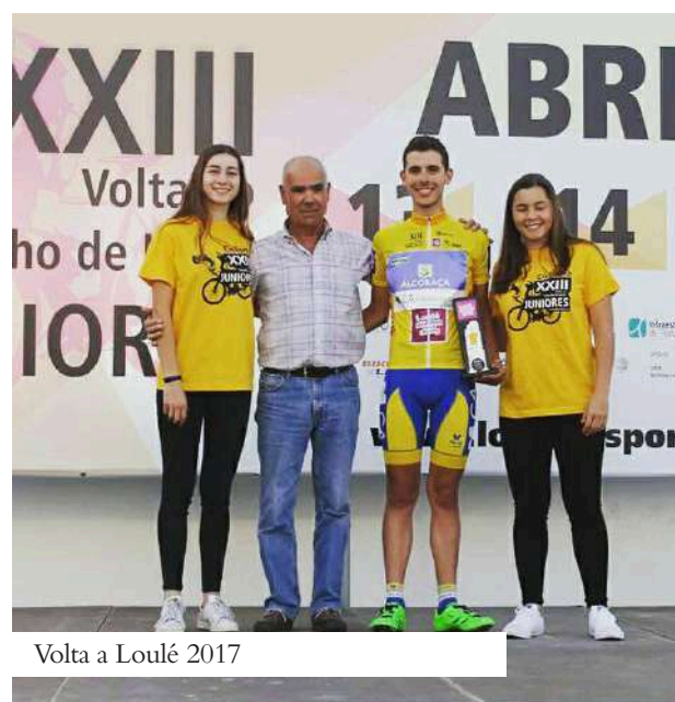
Volta a Loulé 2017