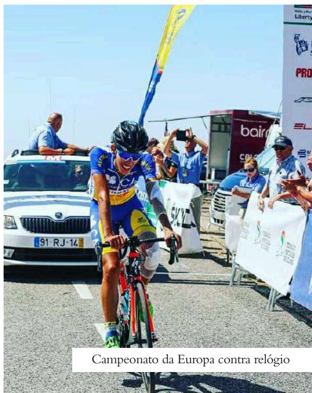
Campeonato da Europa contra relógio