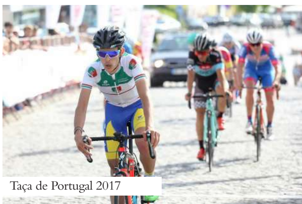
Taça de Portugal 2017

Notícias: Pedro, podes fazer-nos um resumo do teu percurso desde a última vez que te entrevistamos, há 4 anos, estavas tu a terminar o 9.º ano de escolaridade?