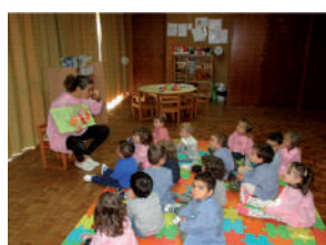
A hora do conto na sala de 2 anos