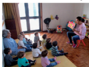
A hora do conto na sala 1 ano

A creche e o jardim de infância são um local privilegiado para a criação de leitores. Quem já não assistiu a muitos simulacros de leitura ensaiados pelas crianças? É precisamente nesta fase que é preciso oferecer-lhe livros, muitos livros, e de um bom trabalho de mediação por parte de educadores e familiares.