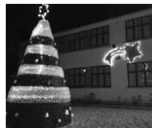
A Comissão de Pais da Pré e E.B.1 de Carreira

Esta iniciativa permitiu proporcionar um ambiente mais natalício a toda a comunidade educativa.