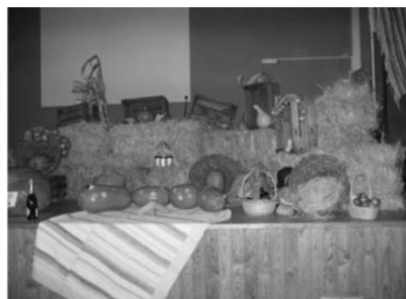
A COMISSÃO DE PAIS (EB 1 Carreira)