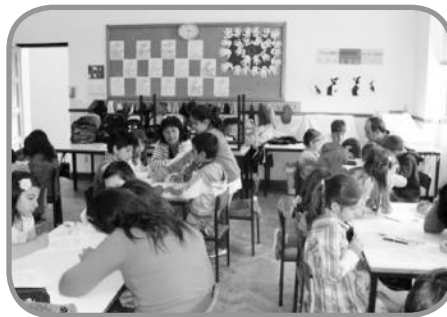
Jogos de Matemática