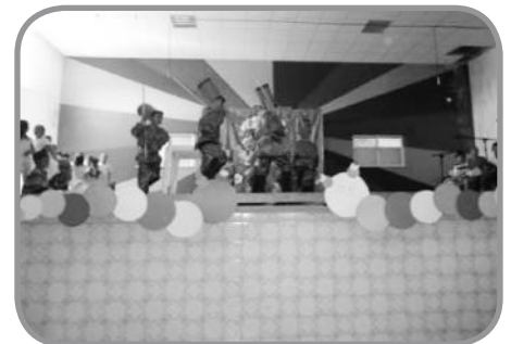
Festa da Criança