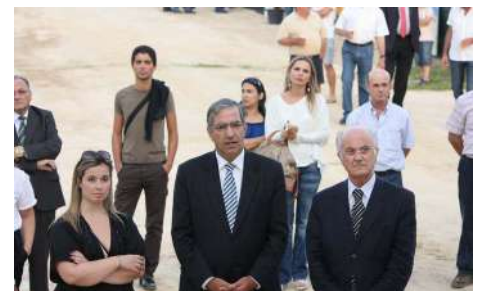
Presidente da Junta, Presidente da Câmara, Sr. Governador Civil