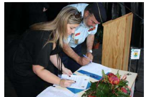
Assinatura do Protocolo com os Bombeiros Voluntários de Leiria