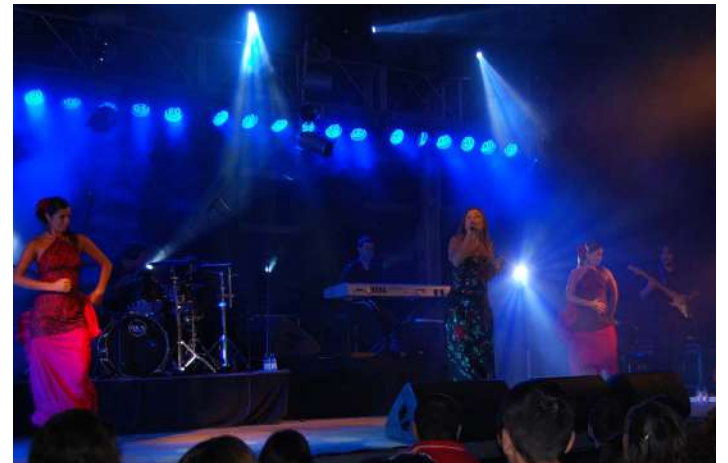
Escola de Dança Diogo Carvalho