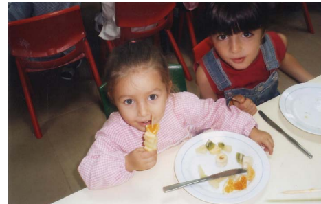
Espetadas de Fruta