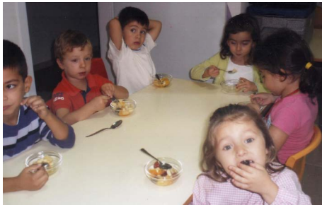
Salada de Fruta

Das várias actividades destaca-se a confecção da Gelatina, porque para as crianças foi uma experiência interessante assim como a composição da tartaruga “Guga”.