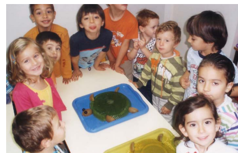
Gelatina: tartaruga Guga