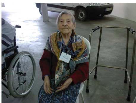
Centro Social Nossa Senhora da Piedade, Monte Redondo

Vimos assim, prestar-lhe homenagem em honra do exemplo que é para todos nós. Muito obrigada!