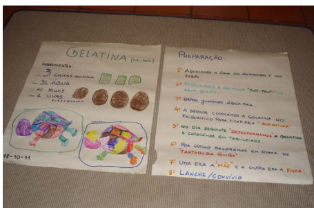
Registo da confecção da gelatina