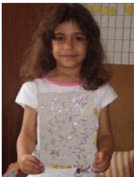
Reciclagem de Papel