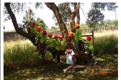
Jardim de Infância de Monte Redondo