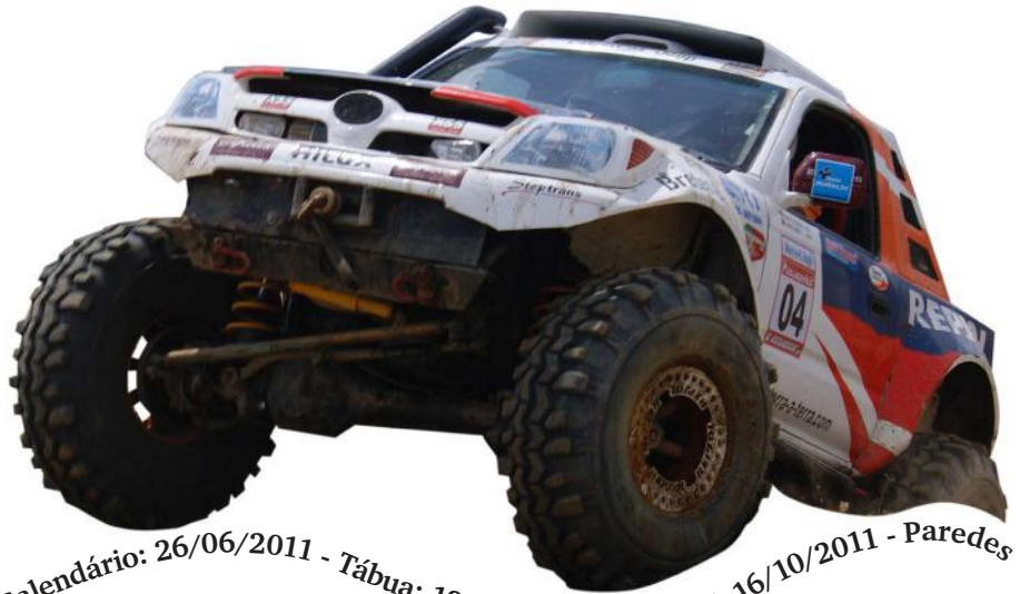
Calendário: 26/06/2011 - Tábua; 18/09/2011 - Lourinhã; 16/10/2011 - Paredes

Sendo uma prova do agrado dos amantes do todo terreno, se for de agrado irei-vos informando dos resultados das restantes provas que ainda faltam realizar.