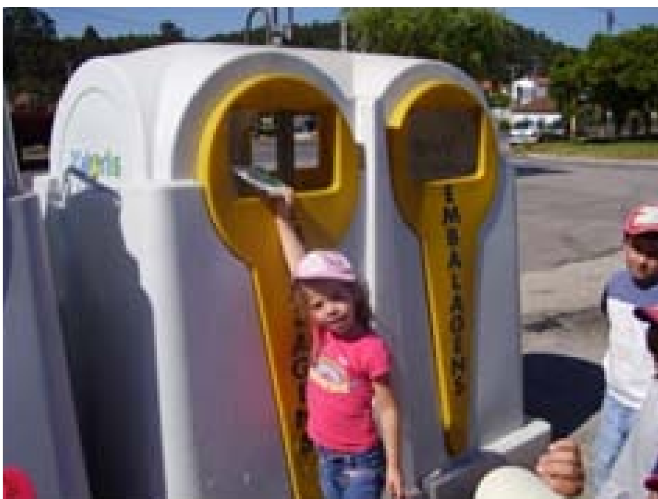
Separação e colocação de lixo nos respectivos ecopontos

Informa-se ainda que a Casa da Criança tem vagas para valência de Creche (crianças dos 3 meses e meio aos 36 meses)