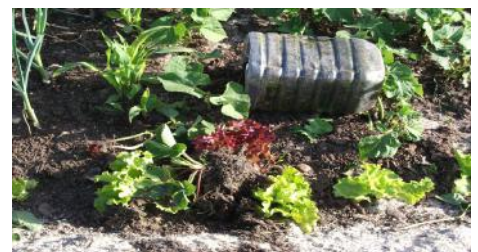
Viraram alguns vasos com morangueiro e atiraram um para cima da horta.