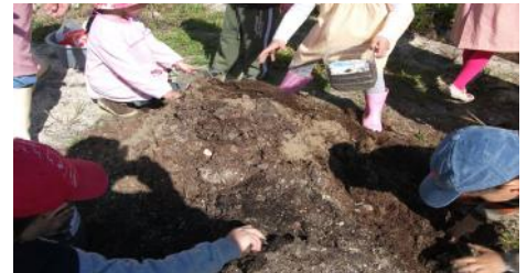
Misturamos muito bem a terra