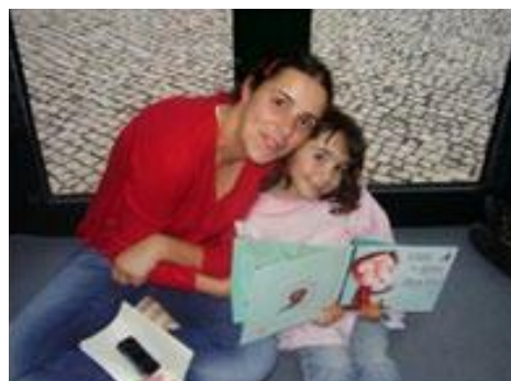
As Mães participam nas actividades da Casa da Criança

Casa da Criança Maria Rita do Patrocínio Costa