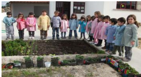
Tapamos com terra e regamos, porque elas gostam, e esperamos...