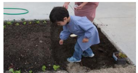
Plantamos alfaces, couves, cebolo... Semeamos muitas sementes: feijão, grão, ervilhas, nabiça, favas, abóboras, girasóis, milho, ...