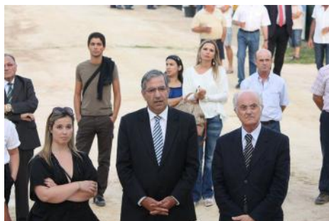
Presidente da Junta, Presidente da Câmara, Sr. Governador Civil

www.osdefensores.com osdefensores@osdefensores.com