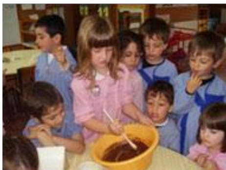
... Fizemos ovos de chocolate