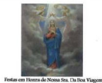
Festas em Honra de Nossa Sra. Da Boa Viagem