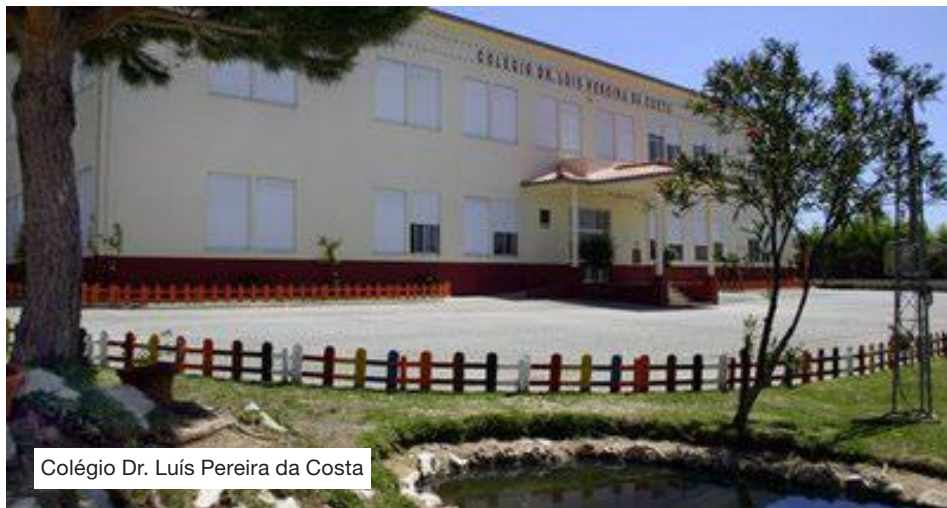
Colégio Dr. Luís Pereira da Costa