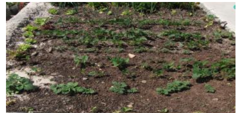
Primeiro nasceram as nabiças, depois o milho, a seguir o feijão e logo se juntaram as outras. Nasceram todas. Estava linda.