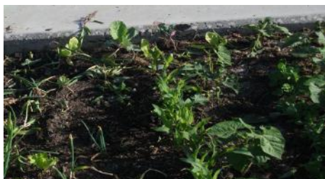
Durante a interrupção lectiva saltaram a vedação e arrancaram alguns feijões, cebolos e uma batateira;