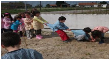
Trouxemos botas de ir para a terra e arrancamos as ervas todas.

Na primeira semana da Primavera pusemos “Mãos à Horta” e preparamos um espaço para fazer uma horta com a colaboração das famílias, que trouxeram terra, sementes e plantas.