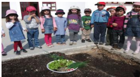
Plantamos alfaces, couves, cebolo...