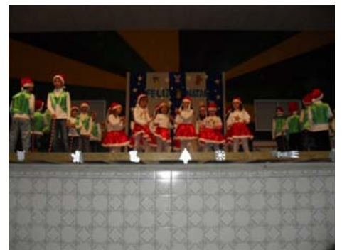
Alunos da EB1 de Lavegadas